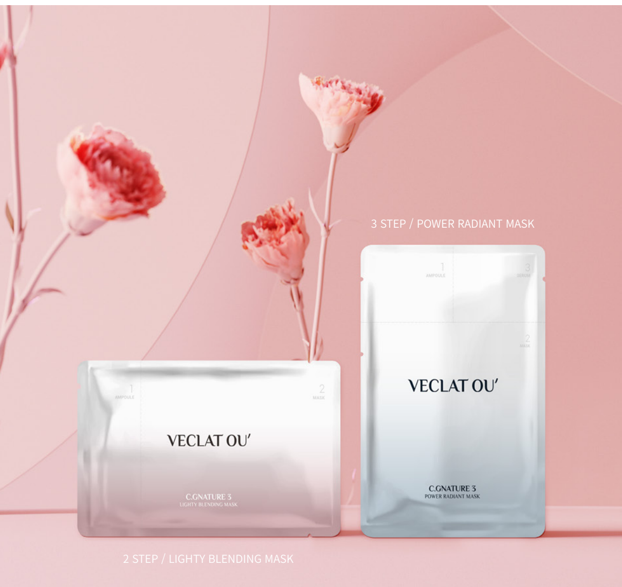
2 STEP / LIGHTY BLENDING MASK

VECLAT OU pleťová maska s čistým vitamínem C a podporou dalších unikátních složek Vyzkoušejte pleťové masky 2-STEP [ampule + maska] / 3-STEP [ampule + maska + sérum].